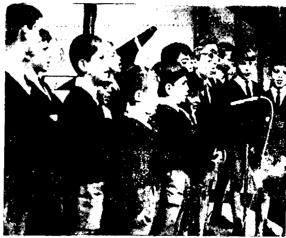
Un momento de la actuación del coro formado por los alumnos del Colegio de Primera Enseñanza